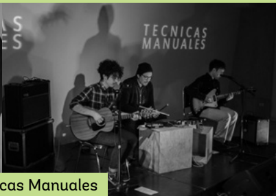
Edición Junio / La Big Rabia + Técnicas Manuales