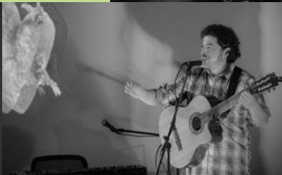
Edición Julio / Diego Peralta + Marcelo Pavés