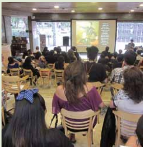
En el curso se indagó sobre la importancia de la noción de comunidad del arte