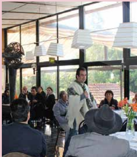
Diálogos de participación cultural indígena