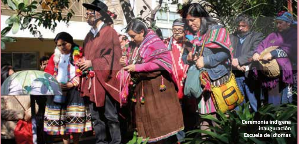
Ceremonia indígena inauguración Escuela de Idiomas

Durante el 2016 el departamento de Pueblos Originarios implementó el Programa de Fomento y Difusión de las Artes y las Culturas de los Pueblos Indígenas, iniciativa destinada a contribuir a la revitalización y fomento de las expresiones artísticas y culturales de los pueblos originarios presentes en el país y de la comunidad afrodescendiente de Arica y Parinacota, desde un enfoque territorial en cumplimiento con el Convenio 169 de la OIT, que permite al CNCA acordar con los pueblos indígenas las líneas de revitalización que serán abordadas en cada región.