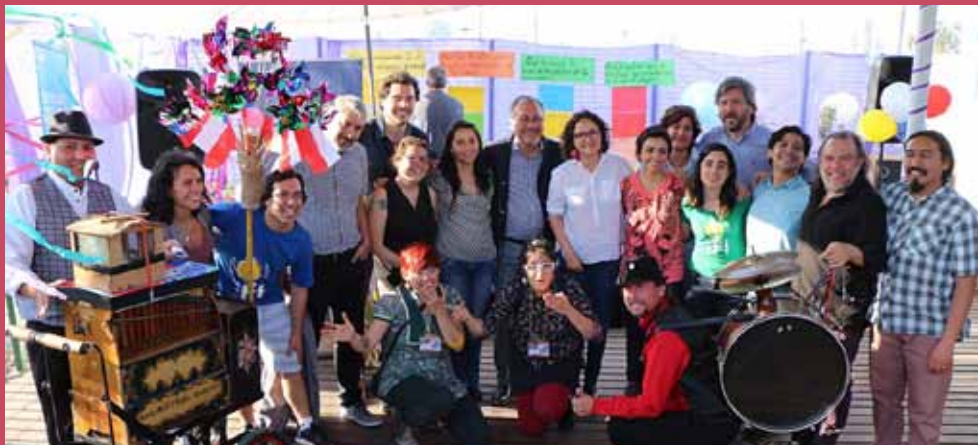
El Centro de Creación de la RM abrió sus puertas en el mes de septiembre a la comunidad

El programa Cecrea corresponde a una medida presidencial que tiene como propósito potenciar, facilitar y desarrollar el derecho a imaginar y crear de niños, niñas y jóvenes (NNJ), a través de procesos de aprendizaje y sistemas de experiencias en los que participan niños y jóvenes entre 7 y 19 años. En Cecrea experimentan, juegan, conversan, desarrollan proyectos y aprenden mediante una extensa programación de laboratorios creativos, de maestranza, de comunicaciones desde la conexión entre las artes, las ciencias, las tecnologías y la sustentabilidad y la realización de escuchas.