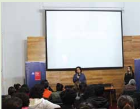
Capacitación de formulación de proyectos en el Archivo Nacional

Asimismo, durante el año 2016, se continuó con la realización de capacitaciones en seis comunas rurales de la región, con el fin de aumentar la descentralización de los fondos.