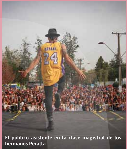
El público asistente en la clase magistral de los hermanos Peralta