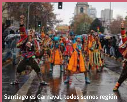
Santiago es Carnaval, todos somos región