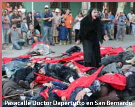
Pasacalle Doctor Dapertutto en San Bernardo

Otro eje de la gestión fue la realización del Primer Festival Metropolitano Centros Culturales en Red. Como parte del trabajo de fortalecimiento de los 18 centros culturales públicos de la región, y a partir de la conformación de la Red de Centros Culturales, se realizó esta iniciativa que contó con la participación de más de 30 agrupaciones artísticas, tanto locales como de amplia trayectoria nacional, en más de 40 presentaciones realizadas en 16 centros culturales públicos, de manera abierta y gratuita. El festival además contó con la realización de siete actividades de mediación, junto a artistas como Manuela García, Los Jaivas, Congreso, Los Tetas, el elenco de la obra Amores de Cantina, la compañía Caldo con Enjundia con la obra "El Catón" y Teatro del Sonido. Más de 10.000 personas asistieron a las distintas instancias del Festival.