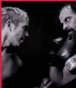
"El Crimen de Layo" el origen de la casta maldita, montaje de la compañía Korpus Teatro

Con este Fondo, durante el periodo 2016 se seleccionaron 126 proyectos en la Región Metropolitana, entregando recursos por $1.342 millones de pesos. El año 2015, hubo 154 proyectos seleccionados en total, 28 más que en el 2016, por un total de $ 1.414.790.169.