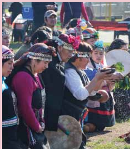
Fiesta del Sol en Recoleta

y rapa nui. Para cada curso se establecieron un mínimo de 20 y un máximo de 30 cupos. Los beneficiarios directos de la Escuela fueron integrantes de 24 organizaciones indígenas de la RM. La Escuela de Idiomas Indígenas funcionó todos los sábados en las aulas de la Universidad Católica Silva Henríquez.