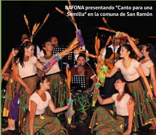
BAFONA presentando "Canto para una Semilla" en la comuna de San Ramón

Con una trayectoria de más de 50 años, ha promovido el rescate y la conservación del patrimonio cultural, manteniendo vivas sus leyendas, ceremonias, tradiciones y costumbres. Sus obras coreográficas se sustentan en estudios antropológicos y artísticos que permiten el conocimiento del hombre y la mujer de Chile, el que después es plasmado y proyectado sobre el escenario.