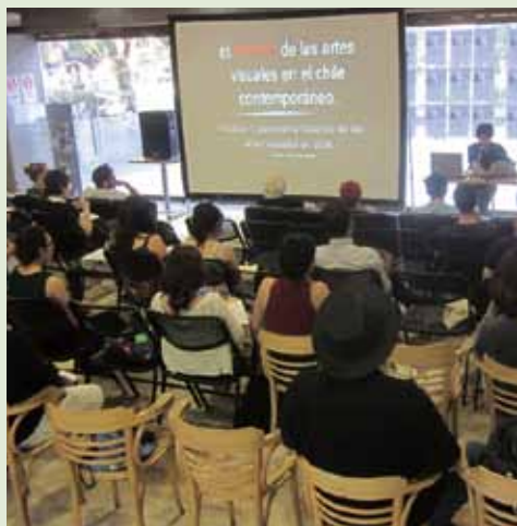
Este curso gratuito buscó generar una reflexión y análisis en torno al sentido de las artes visuales en Chile