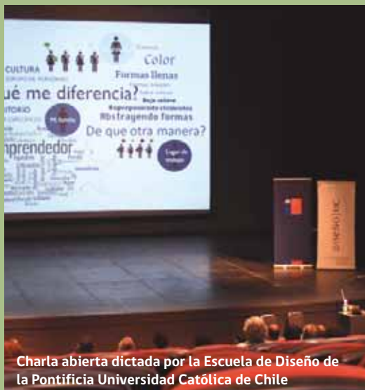
Charla abierta dictada por la Escuela de Diseño de la Pontificia Universidad Católica de Chile

Artesanía, las cuales trataron sobre: conocimiento de la historia personal, construcción de marca y estudios de casos. En las tardes se realizaron talleres prácticos, donde los artesanos realizaron un ejercicio de fotografía para el portafolio personal. Asimismo, cada participante del taller concluyó con un portafolio que facilitó la presentación del artesano y su trabajo, lo que le permitirá potenciar la comercialización de sus productos, postulación a ferias y espacios de exhibición, entre otras iniciativas.