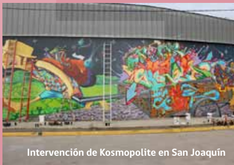
Intervención de Kosmopolite en San Joaquín

El Programa Santiago es Mío es un proyecto emblemático de la Intendencia de la Región Metropolitana, financiado por el Gobierno Regional y ejecutado por el Consejo Nacional de la Cultura y las Artes de la Región Metropolitana. Su duración es de dos años y sus actividades son abiertas y gratuitas para toda la comunidad.