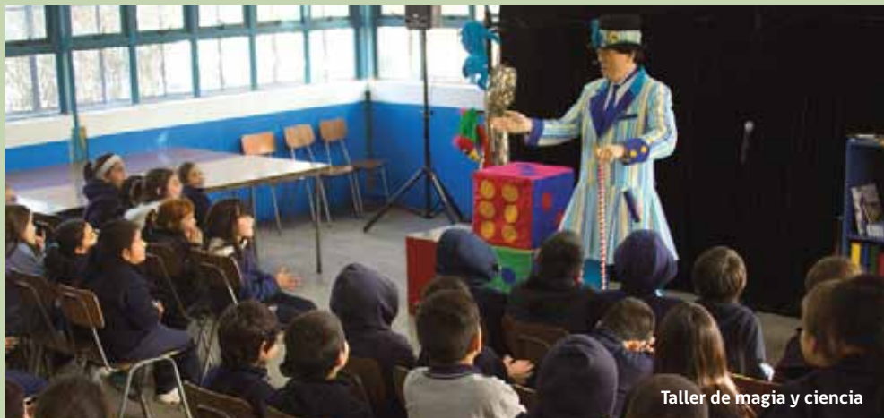
Taller de magia y ciencia