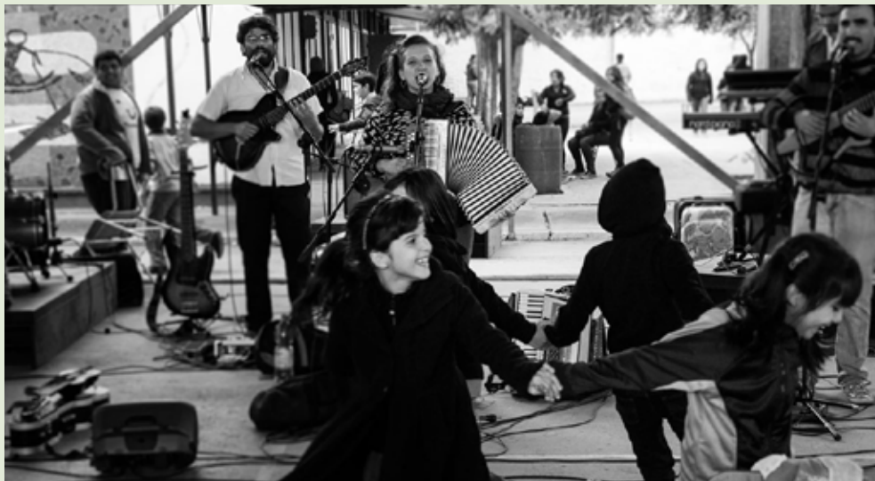
Grupo Merken realizando taller de creatividad vocal

El Programa Fortalecimiento de la Educación Pública a través de la Cultura, FEP, es un proyecto para la educación pública, donde tanto la cultura como el arte, realizan aportes sustantivos para mejorar y fortalecer la educación. Su eje central es la participación de toda la comunidad escolar, para la construcción de experiencias significativas dentro de la escuela.