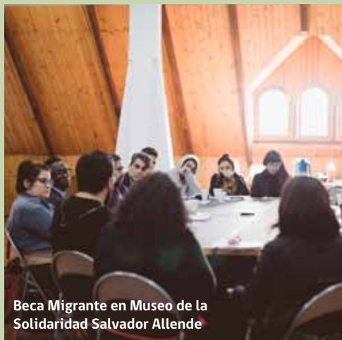
Beca Migrante en Museo de la Solidaridad Salvador Allende

Beca Migrante es un programa que buscó generar nuevos significados a nivel simbólico sobre la inmigración, en la búsqueda de la generación de una sociedad más inclusiva y sensible con esta realidad. La segunda versión de Beca Migrante estuvo dirigida a inmigrantes tanto extranjeros como nacionales, que tuviesen la inquietud de reflexionar por medio de herramientas ligadas a las artes visuales, a educadores que trabajan con alumnos inmigrantes, y a artistas que aborden la inmigración en Chile.