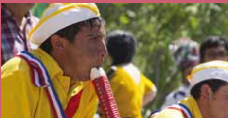
Primer Encuentro Interregional de Bailes Chinos

Durante este año se realizaron dos Encuentros Regionales de Canto a lo Poeta. Uno de ellos realizado en Pirque, iniciativa que se enmarcó dentro de las actividades del Plan Nacional de Salvaguardia del Canto a lo Poeta. En esta ocasión asistieron cerca de 40 cantores, payadores y poetas provenientes de las provincias de Maipo, Cordillera, Santiago, y de la Región de Valparaíso (comuna de Casablanca), a dialogar sobre las problemáticas y acciones de salvaguardia referidas a esta expresión en sus territorios.