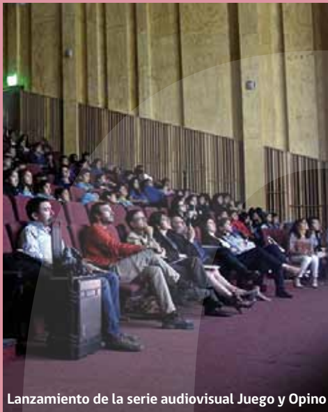
Lanzamiento de la serie audiovisual Juego y Opino

Esta iniciativa fue un espacio de formación colectiva y diálogo en donde se abordaron temas como modelos de construcción de políticas de infancia, relación cultura, creatividad y educación, entre otros temas.