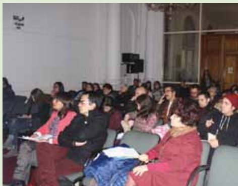
Parte de los asistentes a las capacitaciones de formulación de proyectos