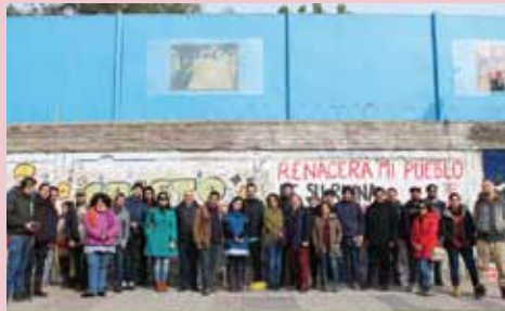
Galería fotográfica abierta en Escuela Básica Su Santidad Juan XXIII Población La Legua, San Joaquín