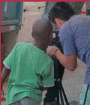
El proyecto Voces Jóvenes Migrantes inauguró exposición en Recoleta