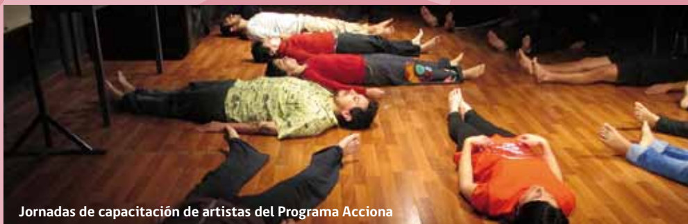
Jornadas de capacitación de artistas del Programa Acciona