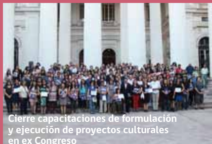
Cierre capacitaciones de formulación y ejecución de proyectos culturales en ex Congreso