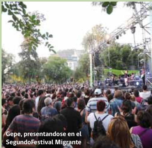
Gepe, presentándose en el Segundo Festival Migrante

El Consejo Nacional de la Cultura y las Artes (CNCA), a través de sus Programas de Escuela de Rock y de Interculturalidad y Migrantes, junto al Departamento de Extranjería y Migración del Ministerio del Interior y la Municipalidad de Providencia, invitaron a disfrutar del Segundo Festival Migrante, evento que se desarrolló en el marco de la celebración del Día Internacional del Migrante instaurado por la ONU.