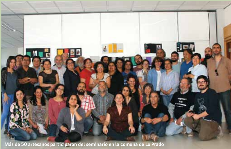
Más de 50 artesanos participaron del seminario en la comuna de Lo Prado

“REFLEXIONANDO SOBRE NUESTRA IDENTIDAD Y CÓMO SACARLE PARTIDO”