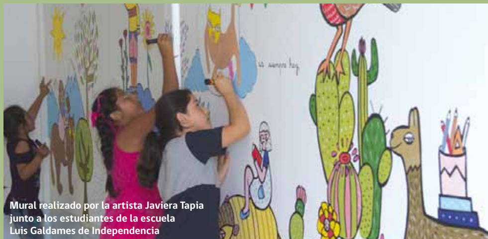
Mural realizado por la artista Javiera Tapia junto a los estudiantes de la escuela Luis Galdames de Independencia

La iniciativa realizó intervenciones en seis establecimientos de la Región Metropolitana: Colegio Unión Nacional Árabe de Peñalolén, Escuela Ciudad de Lyon de El Bosque, Liceo Eugenio María de Hostos, de La Reina, Escuela Municipal Luis Galdames de Independencia y Colegio Buen Consejo de Quinta Normal. Las propuestas que se presentaron para esta convocatoria, tuvieron relación con pintura (trabajo en lienzo con o sin bastidor), plástica (intervención en murallas con plastilina o pintura) e instalación (resignificar elementos presentes en el colegio y transformarlos en obras de arte).