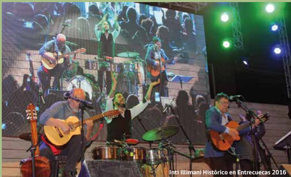
Inti Illimani Histórico en Entrecuecas 2016

Inti Illimani Histórico, el Ballet Folklórico Chileno (BAFOCHI), Los Patiperros de la Cueca, Los Canallas de la Cueca, entre otras agrupaciones, animaron las dos jornadas de la décima versión de este encuentro, organizado por el Consejo Nacional de la Cultura y las Artes de la Región Metropolitana, el Sindicato de Folkloristas de Chile, la Sociedad Chilena del Derecho de Autor (SCD) y la Municipalidad de Peñalolén, mediante su Corporación Cultural.