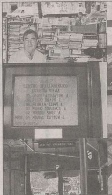
Su RUT? es el título de la exposición colectiva en la galería Gabriela Mistral.