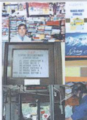
Su Rut?. Galería Gabriela Mistral (Alameda 1381).