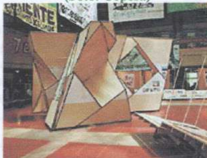
Americida, Un Taller y una Instalación. Museo de Arte Contemporáneo (Parque Forestal s/n T.6380390). Hasta el 25 de