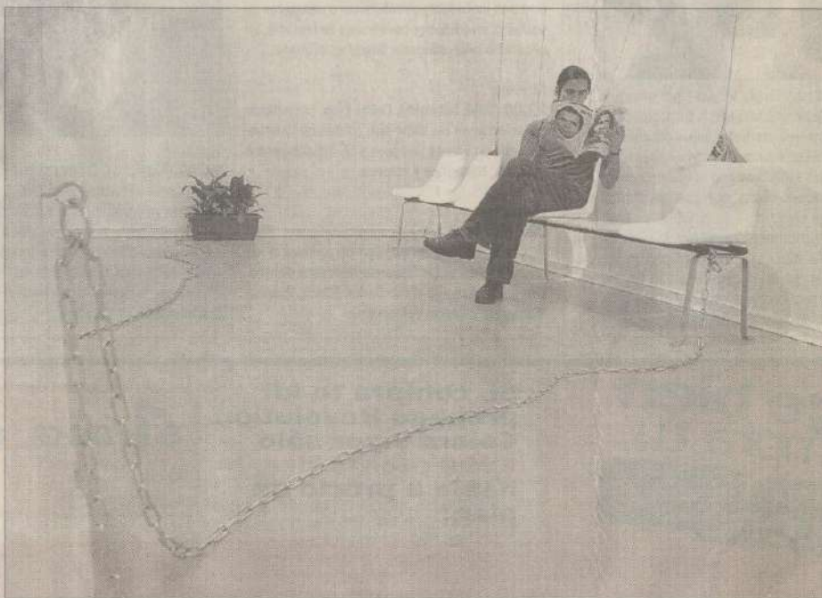
Vista general de la sala de espera incluida en el montaje "Su-RUT?".

La exposición, que se presenta en la Galería Gabriela Mistral (Alameda 1381), se divide en dos partes: la primera -instalada en el hall de entrada- corresponde a una irónica recreación de una sala de espera, compuesta por funcionales asientos de plástico, maceteros con plantas, revistas, un monitor de video en el que