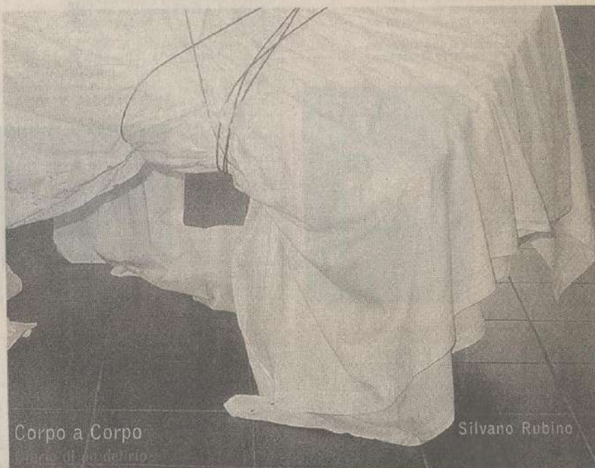
Corpo a Corpo

Detalle de una de las instalaciones del italiano Rubino.