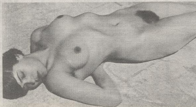
EL RETRATO de Tina Modotti desnuda en una azotea mexicana en 1924 también forma parte de la exposición que se inaugura en la sala Matta del Museo de Bellas Artes.