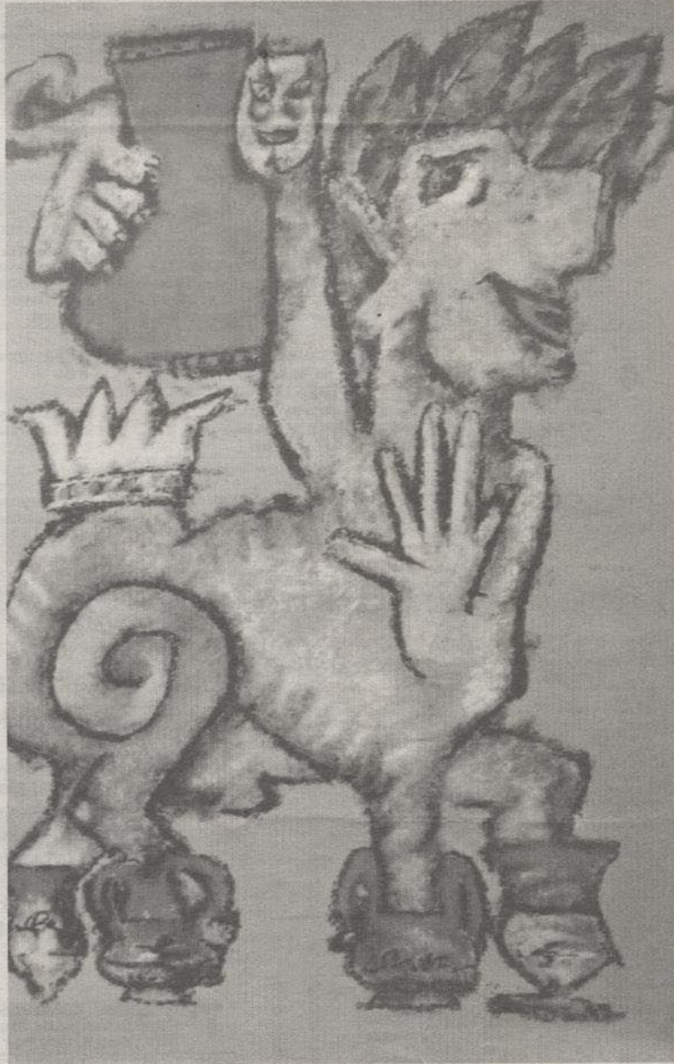
MATTA. La exposición de grabados de la galería Artespacio es la cuarta muestra dedicada al pintor surrealista que se presenta en Chile después de su muerte.

En paralelo, desde hoy y con entrada liberada se exhibe en la Sala Telefónica la muestra del artista catalán Joan Miró con 42 de sus grabados, óleos y esculturas, provenientes de la colección del Museo Nacional Reina Sofía de Madrid.