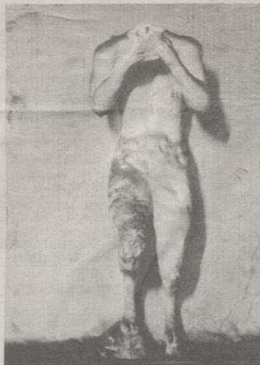
30 AÑOS. Fotografía de Claudio Pérez al cuartel de calle República de la DINA.

► En forma paralela se exponen obras de estas tres figuras de las artes visuales del siglo XX. Además, se exhibe en el MAC el proyecto Chile 30 Años que registra fotográficamente las tres décadas que sucedieron al golpe militar de 1973.