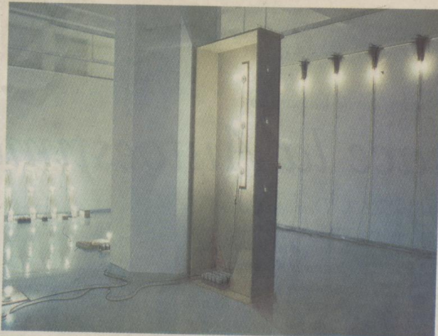
Vista general de la exposición colectiva en la galería Gabriela Mistral.