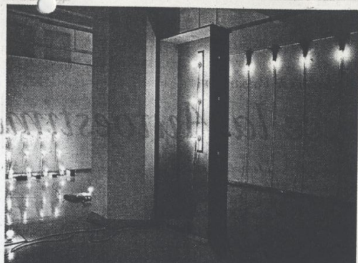
Vista general de la exposición colectiva en la galería Gabriela Mistral.

vez que vengo acá encuentro una exposición más extraña que la anterior. ¿Será que no sé nada de arte? ...pero hay que estar