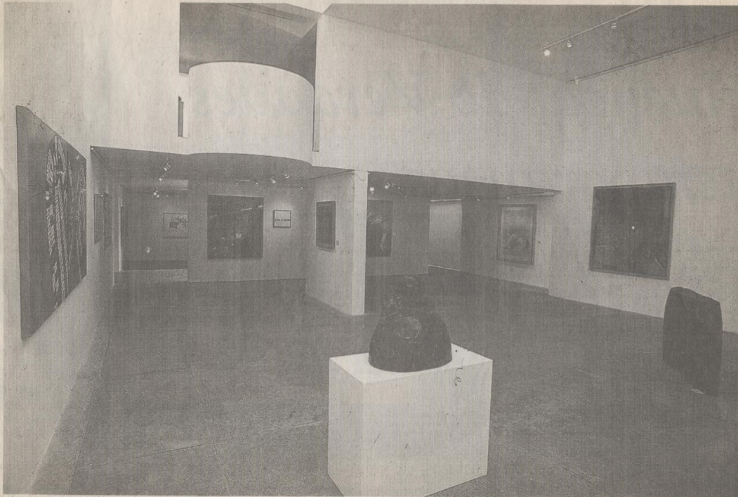
Vista general de la muestra sobre figura humana en la galería AMS Marlborough.