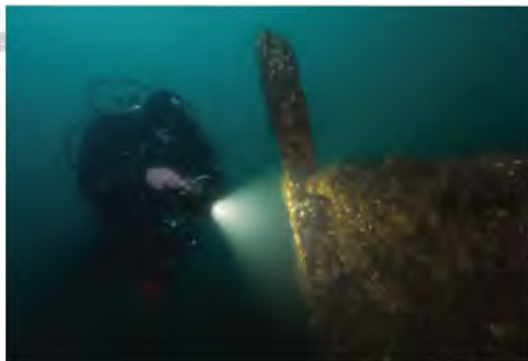
Sitio VP 30, Valparaíso. (D. Letelier)

Con el tiempo, los restos arqueológicos sumergidos han alcanzado un equilibrio físico-químico con su entorno. Al ser extraídos del medio acuático deben ser sometidos a tratamientos de conservación por especialistas o resultarán irremediablemente dañados, y en algunos casos, completamente destruidos. Al ser largos y costosos estos procesos, en condiciones normales, con una tasa de deterioro baja, se privilegia la preservación de los restos en su ambiente (in situ).