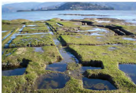
Batería Carboneros, isla del Rey, bahía Corral. (M. Godoy)