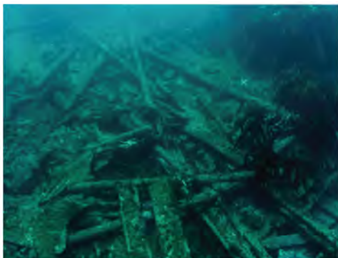
Sitio VP 53, "Las Locitas", Valparaíso . (D. Letelier)

El PCS ofrece una oportunidad única de experimentar el pasado a quienes practican el buceo y contribuye al bienestar del público general a través del turismo, acceso a museos y otras formas de divulgación. Si somos capaces de explorar y comprender este registro material único, estaremos mejor informados sobre nuestro pasado y la mejor forma de proteger y preservar este legado en beneficio de las presentes y futuras generaciones.