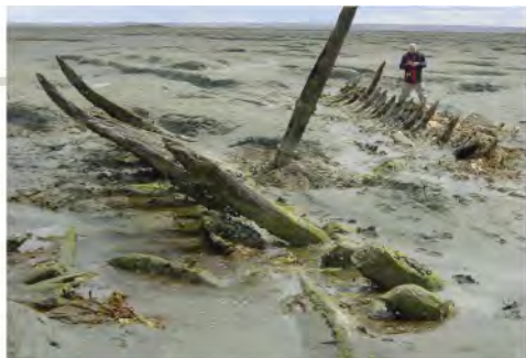
Sitio "Buque Quemado", estrecho de Magallanes. (D. Carabias)

Otros sitios los representan restos de infraestructura militar defensiva, productiva portuaria e industrial que han quedado sumergida parcial o totalmente por actividad geosísmica u otros factores.