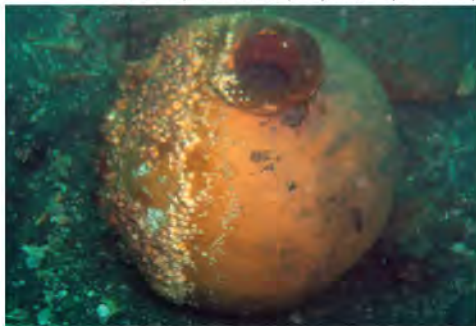
Sitio S3 PV, barca transporte Infatigable, Valparaíso. (R. Simonetti)