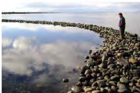
Corral de pesca, Isla Caguach. (R. Álvarez)