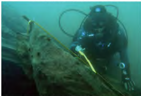
Canoas monóxilas indígenas, lago Pullinque (R. Simonetti)