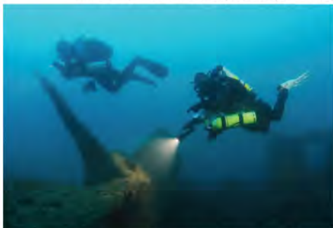
Restos vapor Concepción, Valparaíso. (J. Pastora)