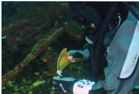
Sitio VP 53, "Las Locitas", Valparaíso. (D. Letelier)