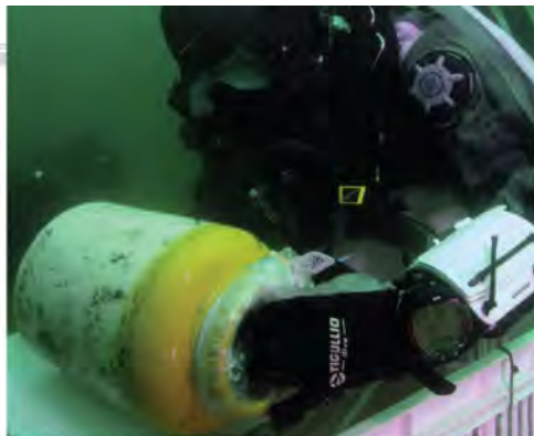
Sitio S3-4 PV, muelle fiscal, Valparaíso. (D. Letelier)

Los restos arqueológicos no deben ser considerados como objetos de valor comercial, explotados con fines especulativos o de lucro, ni dispersados en forma irremediable. Su importancia radica en su invaluable aporte al conocimiento sobre nuestro pasado histórico y cultural. Este principio se halla en conformidad con los preceptos éticos aplicados al patrimonio cultural ubicado en tierra firme.