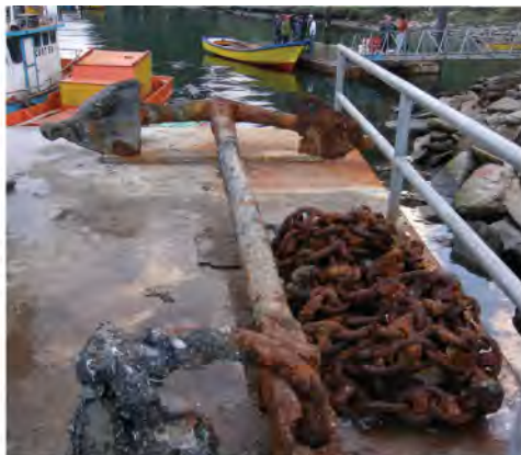
Ancla almirantazgo de La Misión, Niebla. (R. Simonetti)

En Chile, la alteración, extracción, destrucción y/o comercialización de los elementos que conforman el PCS es un delito sancionado con penas de presidio y multas severas. Cualquier presunto hallazgo arqueológico en aguas nacionales o situación de riesgo sobre el PCS debe ser inmediatamente informado al Consejo de Monumentos Nacionales (CMN). También se puede recurrir al Gobernador Provincial, la Autoridad Marítima (DIRECTEMAR, Gobernaciones Marítimas y Capitanías de Puerto), Policía de Investigaciones y Carabineros de Chile, quienes notificarán al CMN.