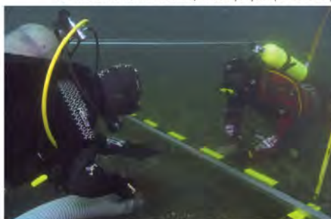
Sitio S3 PV, barca transporte Infatigable, Valparaíso. (D. Letelier)