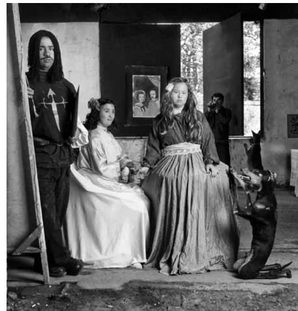
Las Meninas, 2000

Durante el 2012, desarrolló un proyecto llamado Radioretratos que contempla la fusión de fotografía, radio y literatura.