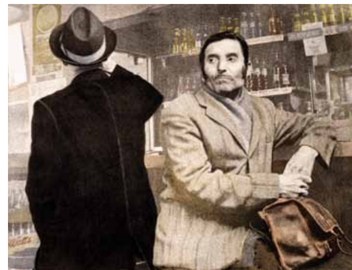
Los Angelitos, 1980