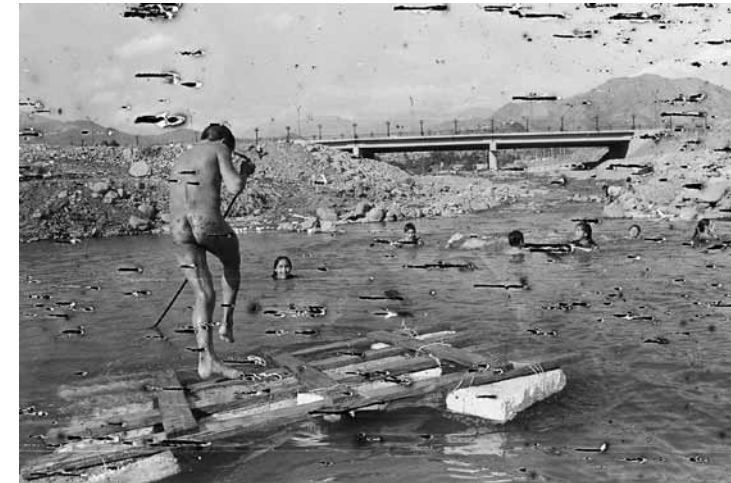
Río Mapocho, 1998

Desde el 2001, colabora en distintos medios locales como La Tercera , La Hora , La Nación y el diario MTG del Metro de Santiago. Actualmente trabaja como editor nocturno en el diario Las Últimas Noticias .