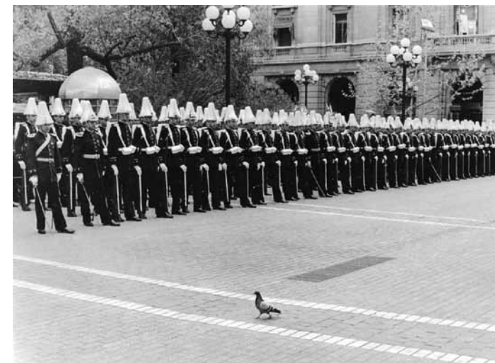
Te Deum, 1980

Sus exposiciones lo han llevado a montar sus obras en países como Francia, Ecuador, Argentina y Chile.