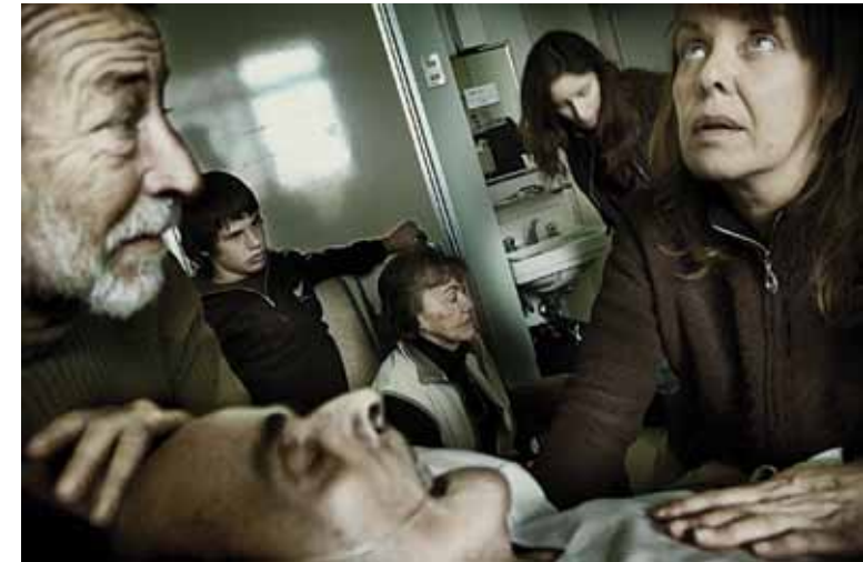
Viña del Mar, 2007

Había un instinto mío como fotógrafo de registrar el proceso y así lo hice.