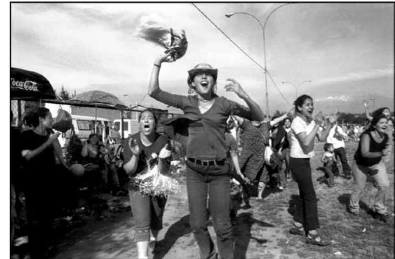
Lo Prado, 2003

Siempre me interesó poder registrar cosas que pasan a mi alrededor.