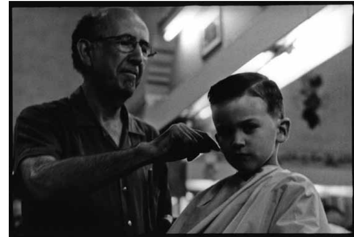
La Peluquería de Tello, 2008

Andaba buscando lugares dentro de Santiago que tuvieran un riesgo de desaparecer