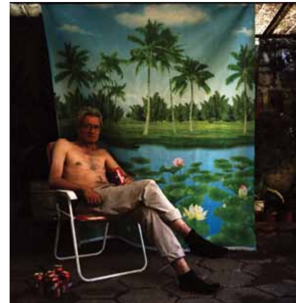
Hogar, dulce hogar, 2011

Su trabajo ha sido publicado por diversas revistas especializadas tanto en Chile como en el extranjero y es representado por Galería 64 en Chile.