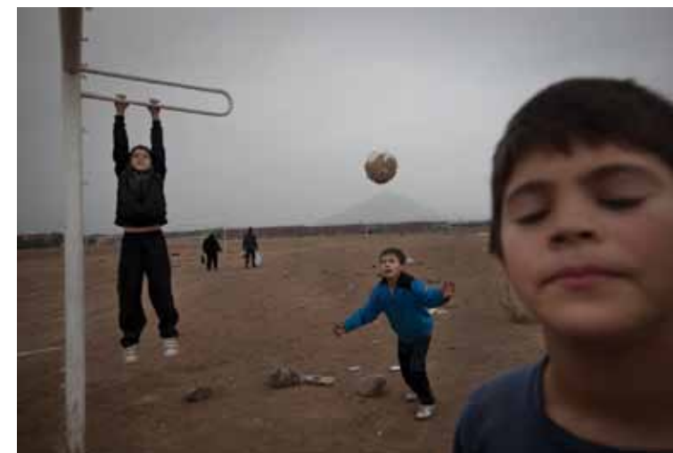
Puente Alto, 2011

Quería hacer un trabajo que fuera un patrimonio iconográfico de cómo cresta se abandona a la gente en este país.