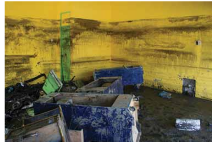
Sin título, serie MARca, 2010

Yo iba básicamente pensando la responsabilidad como arquitecto y como fotógrafo de que las imágenes que iba a construir tenían que hablar acerca de lo vulnerable que es la ciudad cuando está en un borde costero.