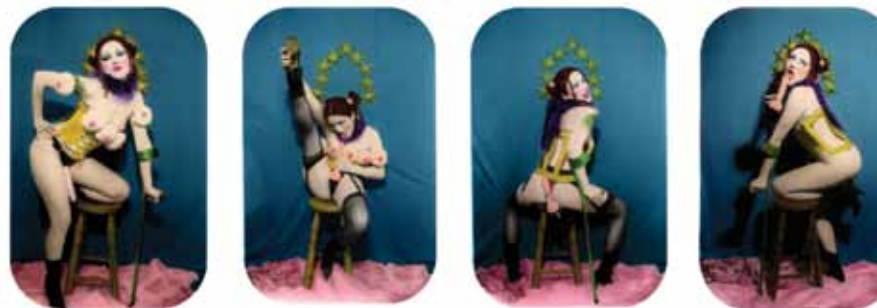
Mis dulces 23, 2001