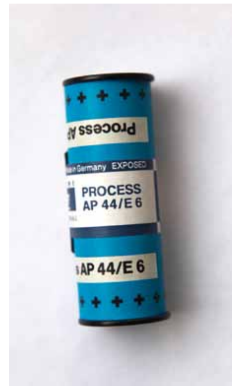
Imagen Latente, 2009

Tengo un problema con la foto, de entender cada vez más profundamente qué es la imagen fotográfica.