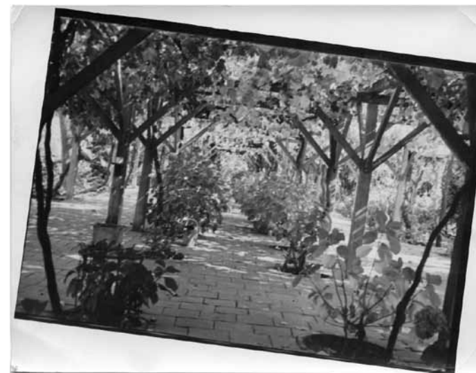
Primera Copia, años 50

Lo que me fascinaba a mí, no era tanto el tema, sino la apropiación de la realidad