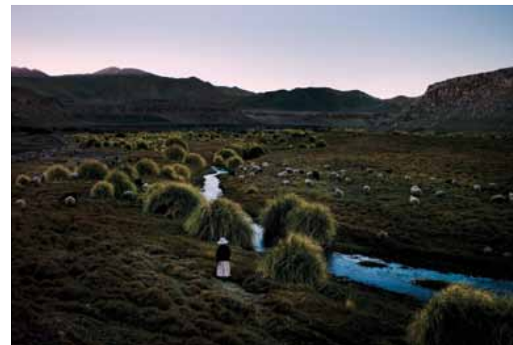
Río Loa, 2011

Y eso es el legado que estamos dejando a las generaciones futuras, en nuestro tiempo, en nuestra vida, se tomó la vida de este río.