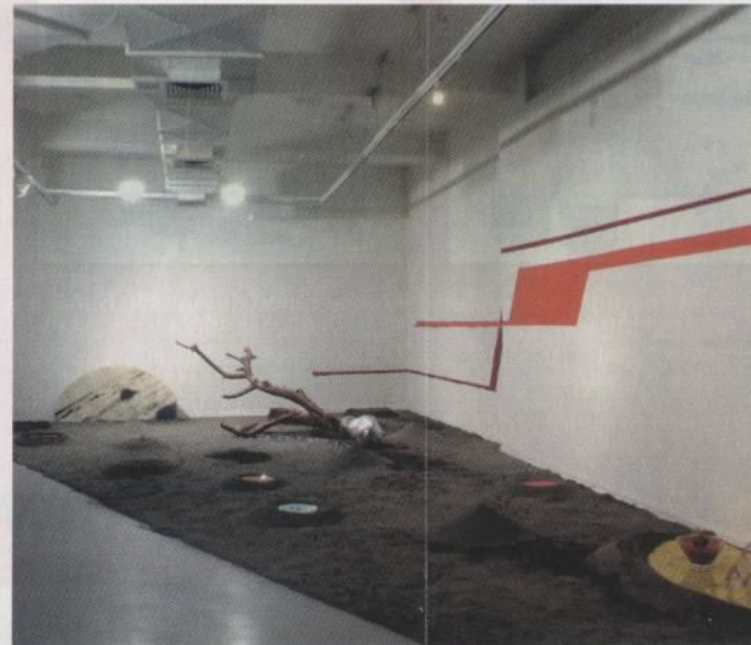
Detalle de la instalación Hirano Ryo, de Carlos Navarrete.

Hirano Ryo, título de la muestra que Navarrete presenta en la galería Gabriela Mistral, fue su lugar de residencia en la ciudad de Kitakyushu, al sur de Japón, adonde llegó el año 2000 invitado por un programa de intercambio cultural. Evocando instancias de aquella extraña permanencia, la exposición está constituida por varios conjuntos de objetos cotidianos, piezas gráficas y una instalación principal sobre un triángulo de arena -formato alusivo a un jardín zen, y semejante