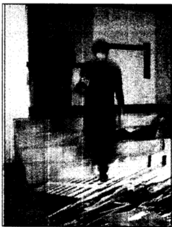
Intervención pictórica de C. Correa.

Gonzalo Díaz apuesta por este grupo: "Aunque la muerte de la pintura ha sido tantas veces declarada, y en los grandes encuentros de arte internacional se ven pocas pinturas y más instalaciones, siempre se sigue pintando. Estas obras ya han tenido notoriedad, resistiendo este contexto y demostrando que tienen fibra".