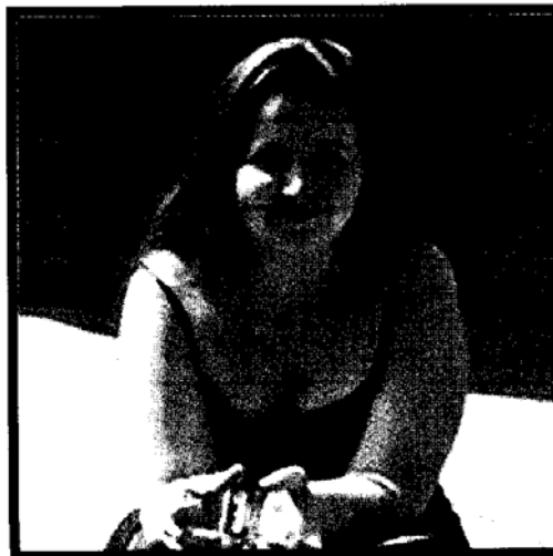
La artista chilena Voluspa Jarpa.

Quizás es por estos detalles que la muestra se despliega desde la sala principal de la galería, siguiendo un plan de trabajo que va desde 1997 cuando Voluspa plantea la incorporación de objetos tridimensionales, a las maquetas utilizadas previamente (La casa y sus adjetivos, First Person Plural)