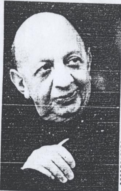
"Aquí estoy aprisionado por la presencia del pájaro negro que es la muerte. Toda la obra está trabajada en base a una numerología. Los tempos son múltiples de 7, que es un guarismo sagrado, y también hay melodiosos que nosotros tocamos ante los difuntos", dice el compositor chileno radicado en Israel.

"Me es muy difícil hablar de ella. La hice durante la agonía de mi mujer. Todo lo que observé, todo el diálogo que hubo con ella, todo lo que iba viendo, la despedida de la vida, su significado y el poder de la muerte. Aquí estoy aprisionado por la presencia del pájaro negro que es la muerte. Toda la obra está trabajada en base a una numerología. Los tempos son múltiples de 7, que es un gua-