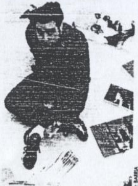
Luego de esta muestra, el artista viajará a México para la realización de un proyecto experimental que propone técnicas como el vidrio y el video a modo de soporte.