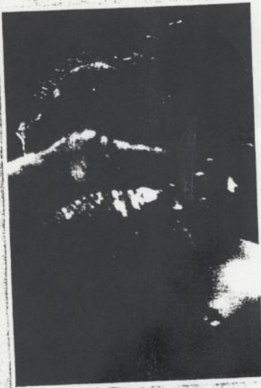
«La podadora», de Alonso Yáñez. Fotografía de 100 x 150 centímetros. 1995.