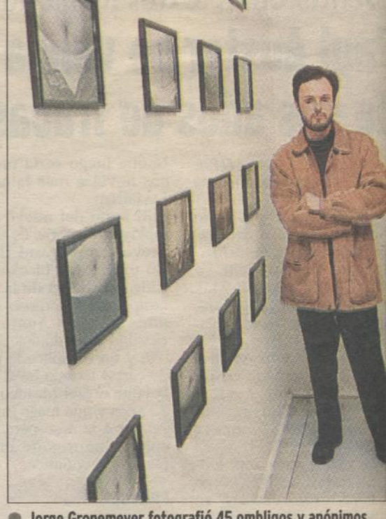
● Jorge Gronemeyer fotografió 45 ombligos y anónimos.

Tres salas santiaguinas ofrecen interesante variedad plástica