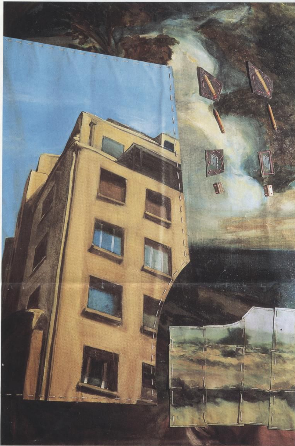
Langlois. La casa . 160 x 165 cms. Oleo sobre tela, costura, aplicaciones. 1994.