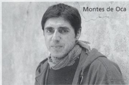
Montes de Oca