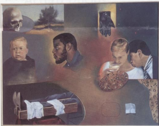
Vega. Sin título. 120 x 145 cms. Oleo sobre tela. Arriba: Sin título. 145 x 207 cms. Acrílico collage. Proyecto obra Zona Fantasma. 1996.