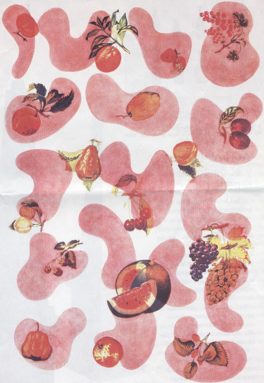
COMPOSITION SUPREMATISTE N° 10 © 1995 A. Duclos

Arturo Duclos. Composición suprematiste N° 10 . 190 x 140 cms. Acrílico, óleo y transferencia láser sobre tela. 1995.