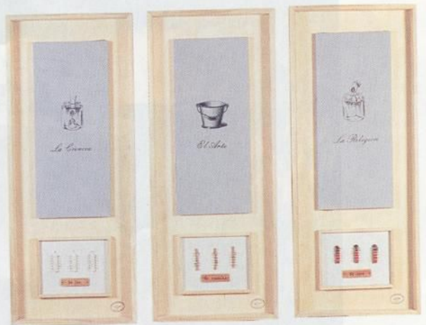
Montes de Oca. Las Tres Gracias . Técnica mixta. 1994.