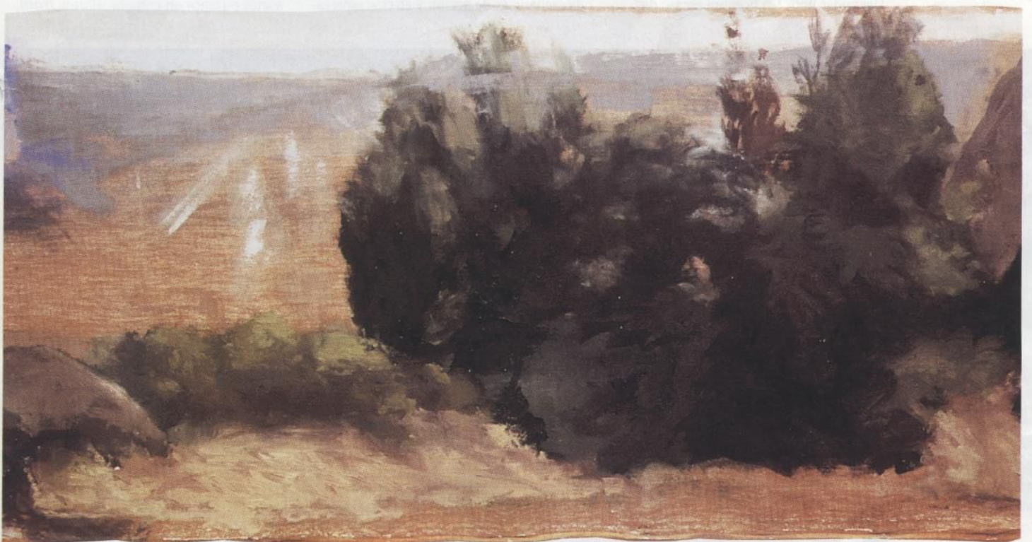
Angostura de Paine (detalle). 90 x 240 cms. Oleo sobre tela. Proyecto Zona Fantasma , galería Gabriela Mistral. 1996.