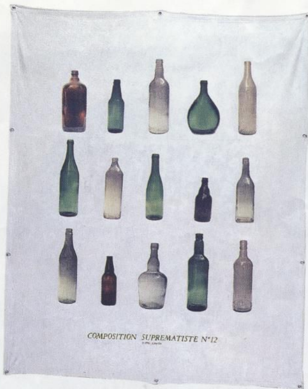
Duclos. Composición suprematiste N° 12 . 176 x 143 cms. Acrílico y transferencia láser sobre tela. 1995.