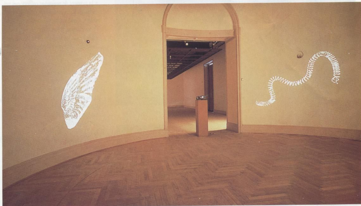
Villarreal. Por el ojo de mi cámara . Objetos y proyección. Instalación Museo de Bellas Artes. 1989.