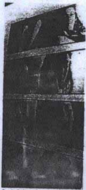
Sus trabajos quieren mostrar un arte extra-joven.