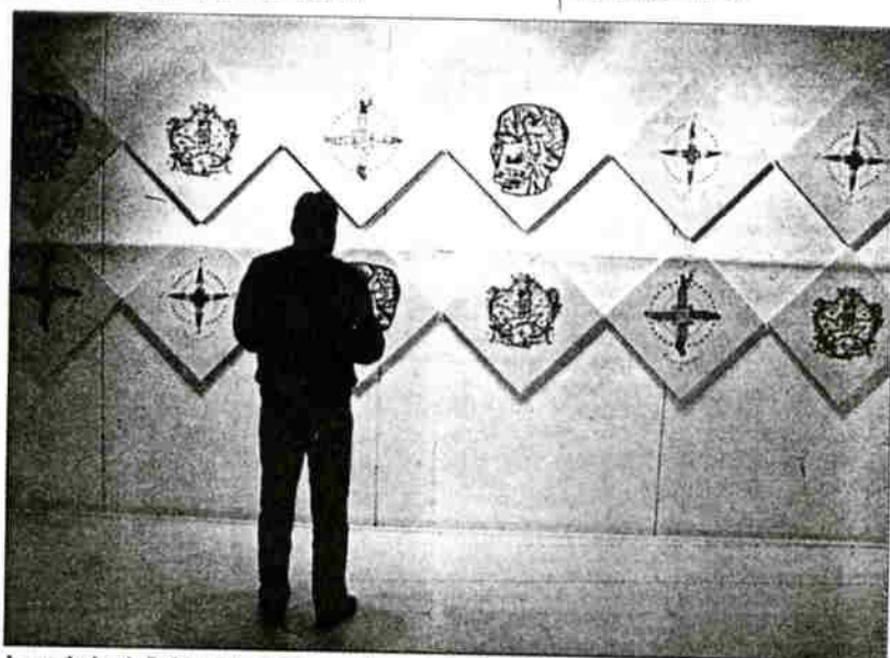
Los grabados de Rodrigo Cabezas plasman (computacionalmente) la "Rosa de los vientos" de Bruna Truffa.

Desilusionados por los actuales discursos, emprenden con "energía y vitalidad" la construcción de símbolos visuales ya que "la pintura es el único sistema de representación poético no racional para seguir narrando".