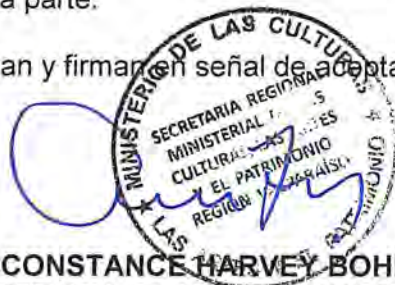
CONSTANCE HARVEY BOHN SECRETARIA REGIONAL MINISTERIAL DE LAS CULTURAS, LAS ARTES Y EL PATRIMONIO VALPARAÍSO