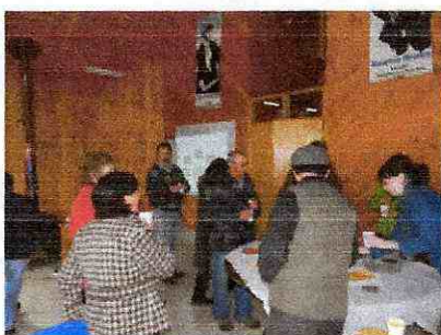
Ilustración 2: La hora del café.

La actividad consideró cuatro partes: discusión sobre orientaciones generales sobre el turismo y la cultura en el territorio (capítulos 1 y 2 del Manual) y la gestión de iniciativas turísticas asociativas y sustentables (capítulo 4). Finalmente, tras un café, se procedió a registrar las apreciaciones de acuerdo a pauta preestablecida.