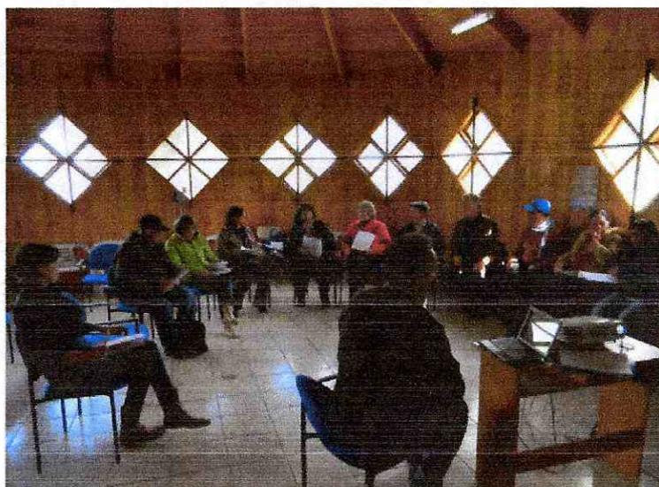
Ilustración 1: Un aspecto del taller.