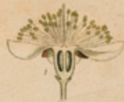
Pl. 104. Myrte . Myrtus communis Famille des Myrtacées.