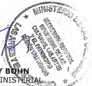
CONSTANCE HARVEY BOHN SECRETARIA REGIONAL MINISTERIAL DE LAS CULTURAS, LAS ARTES Y EL PATRIMONIO MINISTERIO DE LAS CULTURAS, LAS ARTES Y EL PATRIMONIO REGIÓN DE VALPARAÍSO

El informe de actividades corresponde al Informe Final , por lo tanto procede el cierre total del proyecto.