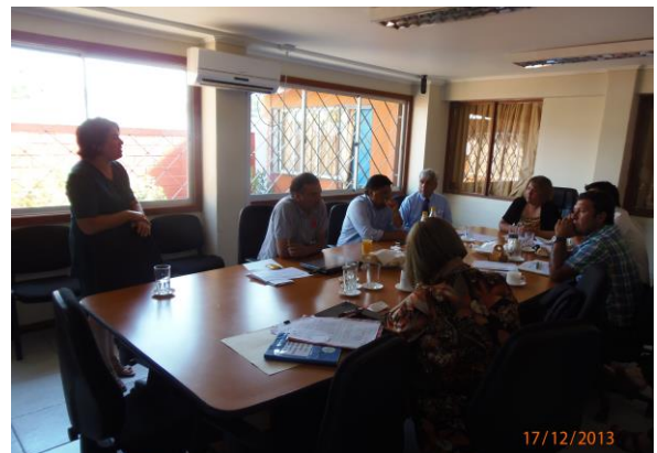
APROBACION PLADECUL (17-DICIEMBRE-2013)