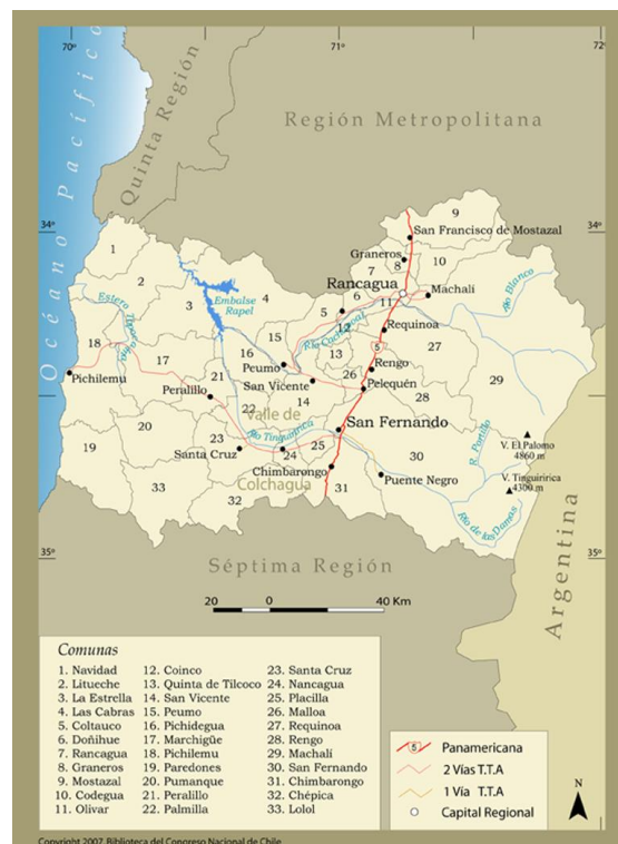
Figura 2.2-1. Ubicación Político Administrativa

En el último censo de población (2002), se registraron 780.627 habitantes (392.335 hombres y 388.292 mujeres), representando el 5,2% de la población nacional. La densidad de 47,63 hab/km 2 . El crecimiento anual para el período 2000-2005, era de 1,20 personas por cada 100 habitantes. Por tanto, la estimación era que al 2008, los habitantes de la Región de O'Higgins llegaron a 866.249 personas.