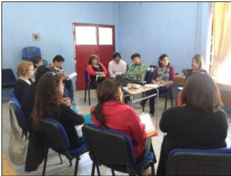
Imagen 2. Taller participativo diagnóstico

A continuación, se presentan los resultados del diagnóstico cultural elaborado que sienta las bases para el desarrollo del Plan de Gestión del Centro Cultural. Este proceso se desarrolló bajo una lógica participativa, a partir de diversos encuentros sostenidos con la comunidad, actores culturales relevantes del territorio y con la institucionalidad comunal, como se detalló anteriormente. Asimismo, se conjuga con la revisión de fuentes secundarias referenciales a nivel comunal, regional y nacional. De este modo, un primer punto del diagnóstico presenta los antecedentes comunales, en segundo lugar se da cuenta de los antecedentes de la identidad cultural y un tercer ítem revela la percepción comunitaria en una serie de dimensiones. Un cuarto apartado reúne información pertinente en torno a la participación cultural y finalmente se plantea un Análisis FODA que sintetiza los principales aspectos recabados durante la fase de diagnóstico y que da pie para el planteamiento de los principales aspectos del Plan de Gestión.