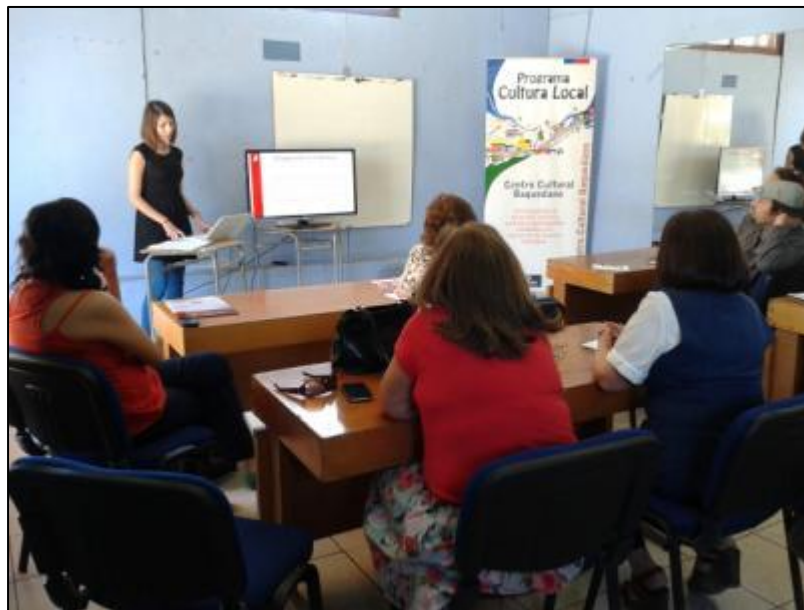
Imagen 1. Taller de validación de la propuesta de Plan de Gestión

Para concluir, se realizaron instancias de validación con la comunidad, y con la institucionalidad municipal pertinente. En ellas, se presentó el trabajo elaborado y se recogieron sus comentarios y los ajustes sugeridos al Plan de Gestión realizado.