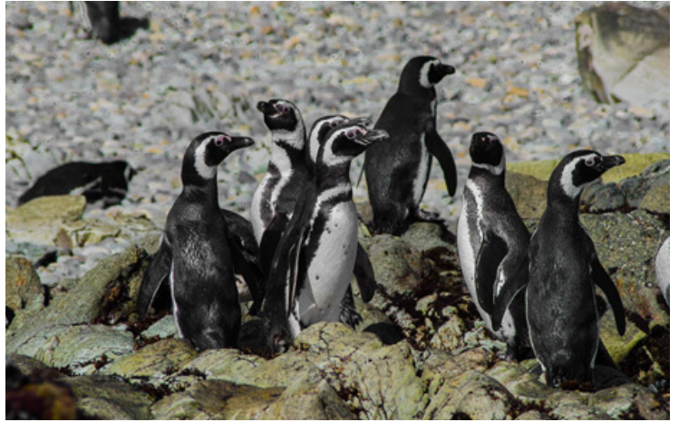
Pinguino de Magallanes, sector Isla Ica