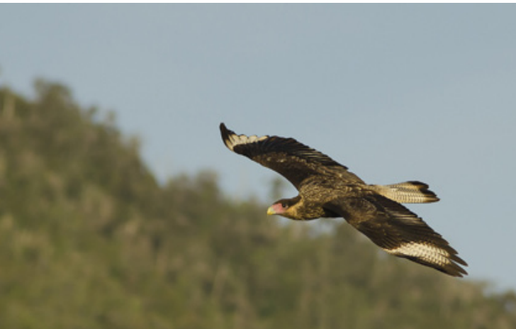
Traro o Carancho, Buill