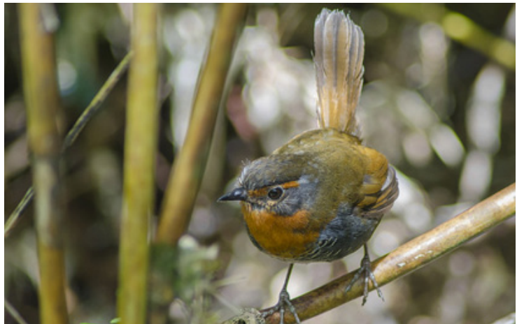
7 Chucao, Buill