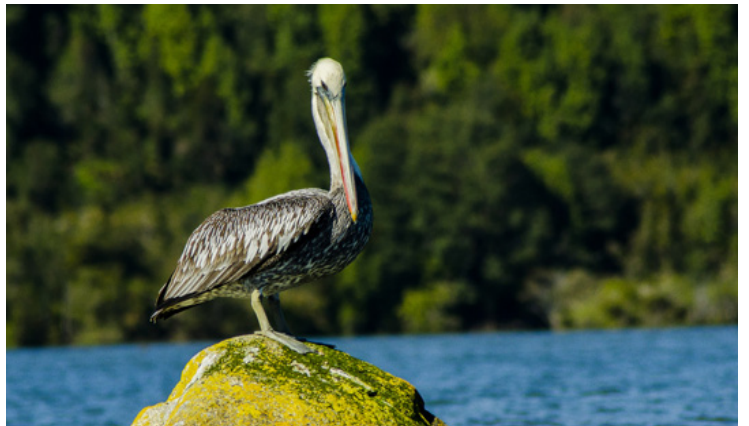
Pelícano, desembocadura río Huequi