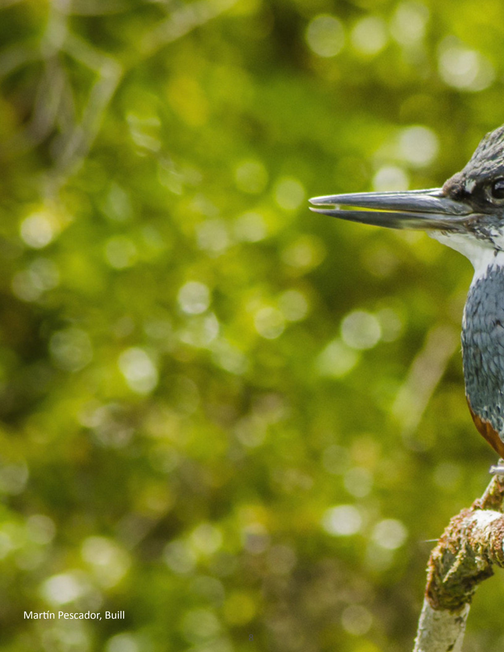
Martín Pescador, Buill