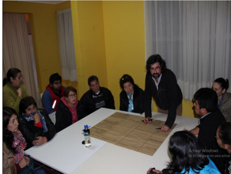
Matriz diagnóstica participativo Dalcahue / grupo 1