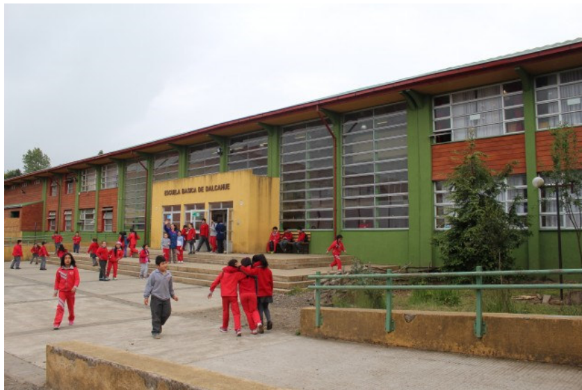
Escuela básica de Dalcahue

De acuerdo a la información de la Biblioteca del Congreso para el 2014, la distribución de la matrícula entre establecimientos públicos y privados es del 50%.