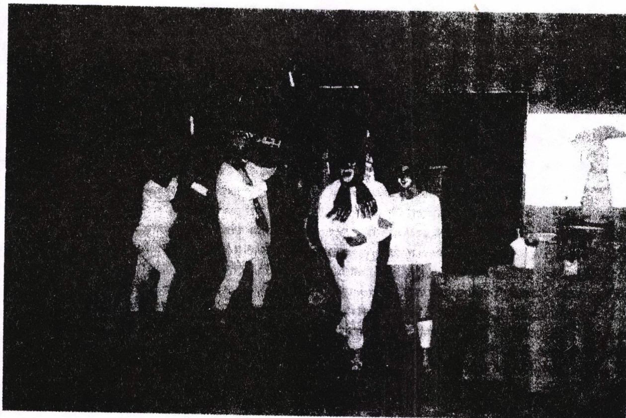
Seguimiento y evaluación, grupo No Más, Iquique.

mica, cuya ubicación en el currículum es análoga a las asignaturas de Artes Visuales y Artes Musicales.