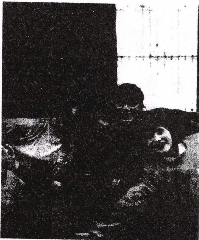
Grupo Teatro Escolar, I Región.

Expresión Dramática como una excelente base para formar buenos futuros actores y actrices.